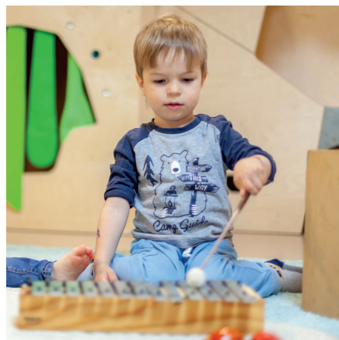
Künftig gibt es im Kindergarten Mittendrin ein eigenes Kursangebot für musikalische Früherziehung. Die Anmeldung erfolgt über die Kindergartenleitung.

Besonders angenehm für Eltern ist, dass das Angebot am Vormittag stattfindet, also während der Betreuungszeit. Zur Kursstunde werden die angemeldeten Kinder in ihrer Gruppe abgeholt und wieder zurückgebracht. Eine Gruppe umfasst bis zu zehn Kinder. Die musikalische Früherziehung wird für ein Jahr gebucht und bezahlt. Interessierte Familien dürfen gerne die Kindergartenleitung Marion Mörtl ansprechen.